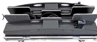
FC-2CLA810 (29 Kg)