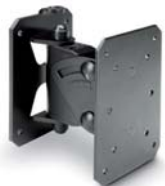
HO-RI-SR20(B/W) CLA-810的黑色或白色固定球